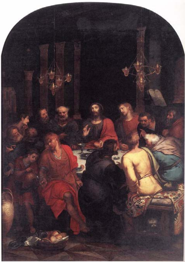
VEEN, Otto van The Last Supper 1592