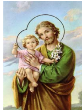
The dream of St. Joseph LA TOUR, Georges De 1593 Museum des Beaux-Arts, Nantes

我的祈禱： 主，求祢帶領所有做父親的追隨祢，並能效法聖若瑟，好好工作和照顧自己的家庭。