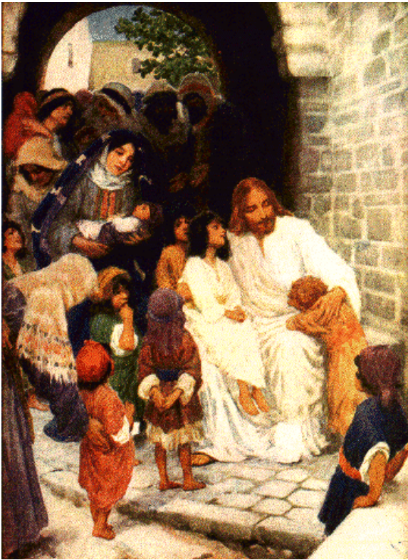
Christ Blesses Little Children, by C.F. Vos

父啊！天地的主宰，我稱謝祢，因為祢將這些事瞞住了智慧及明達的人，而啓示了給小孩子。(路 10:21)