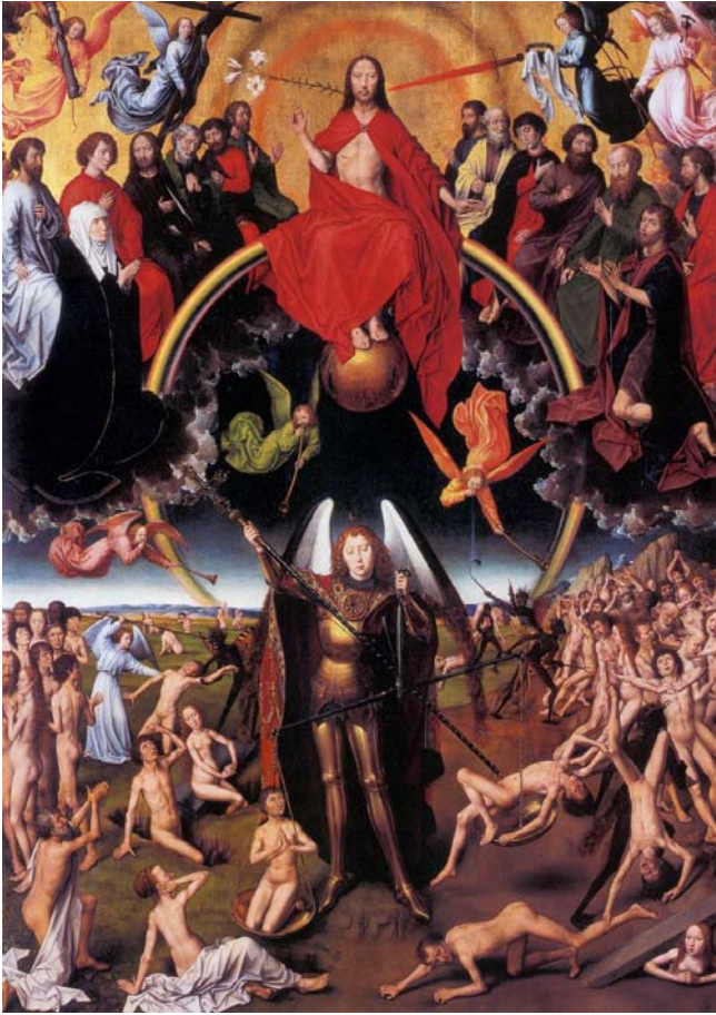
MEMLING, Hans, Last Judgment Triptych (central) 1467-71, Muzeum Narodowe, Gdansk

默想： 今天依撒意亞先知書的片段是有關他預見末日的景象，這圖像實在美極了！天主的王國將統馭萬邦；萬民將皈依上主，趨向上主的真理，遵行祂的聖道。那時，民族與民族不再持刀相向，人不再戰鬥；刀劍將鑄成鋤頭，槍矛將製成鐮刀。生活在今世的我們，想必很嚮往這個國度的來臨。