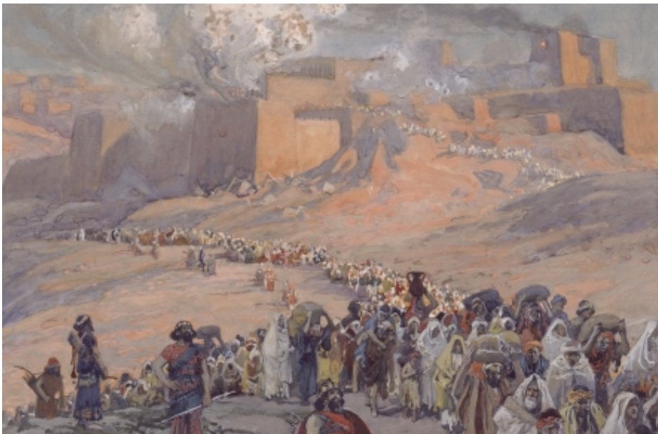
猶太人被擄往巴比倫飽受充軍之苦

默想： 每次感恩祭的開始時，主禮神父都與教友們打個招呼：願主與你們同在！大家當時的感覺是如何？有否感到上主的平安就在我們的心內。