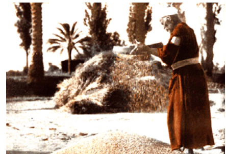
農夫收成時分隔開莠子和其他有益的農作物。

我的祈禱： 社會上結構性的罪荼毒不知多少人，尤其是成長中的青少年，讓眾人都陷入罪的氛圍中。主，求你憐憫我們，以慈悲的目光憐視我們，救援我們，讓我們知所悔改，免去罪債，學習度天國正義的生活。主，我感謝你對人類和對我無條件的愛，讓我學習有一顆寬容對人的心，仰賴你接納不同的人物事情，藉着你的真光，帶領我善度現世的生活。