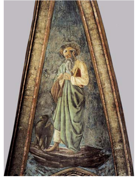
ANDREA DEL CASTAGNO St John the Evangelist, 1442 San Zaccaria, Venice

默想： 今天選讀的福音是聖史若望的一份由衷感嘆：天主竟這樣愛了世界，但世人卻不領情。若望跟隨主耶穌三年，親聆祂天國的教誨，見證祂天主的能力。耶穌升天後，若望以數十年的時間默想與參悟耶穌的言行，在垂暮之年，寫下的福音，可視作他悟道的感言。他參透的玄機就是：天主是愛，祂愛世人無以復加。我們可以想像，若望是多麼渴望全世界的人都能夠相信和接受，耶穌的一生就是天主愛人的極致表現。