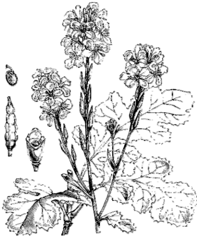
Mustard ( Sinapis nigra ), which grows very tall in Palestine. - cf Mt.13.31-32, Mk.4.30-32, Lk.13.18-19.

聖人於 1225 年左右，出生於意大利阿奎納公爵之家。先後在加西諾山隱修院及拿玻里求學。1244-1245 年，當他志到道明會修道時，他的家人竟把他軟禁起來；最終，他加入了道明會，先後在巴黎與科隆，從聖大亞爾伯為師，完成學業；1257 年，與聖文德一起，同獲博士學位。聖人理性思維，有關哲學神學，精深著作甚多，尤其《神學大全》一書，影響深遠；他教授生徒，為教會一大明師。1274 年 3 月 7 日逝世於意大利。1369 年 1 月 28 日聖人之遺骸，移葬於法國杜魯茲，故教會定本日為其紀念日。聖人被譽為「天使聖師」，以稱許他的純潔和探玄入奧的智識，可與天使相比。(摘自禮委)